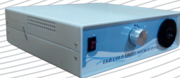
L1.7 معاینه و تشخیص